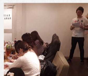
飲食店経営者による特別講義